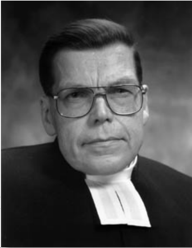
JMG-Studio, KAJ LINDQVIST

Luterilaista kirkkoa on monesti piikitelty sen nimestä. Se kehuu olevansa raamatullisten tunnusmerkkien mukainen kirkko, mutta kytkee jo nimessään itsensä yhteen henkilöön. Luther ei kylläkään nimestä pitänyt, vaan toivoi yksinkertaisesti nimikettä »kristillinen». Mutta tällaiseksi se jämähti osaksi vastustajien toimesta ja tilanteen pakosta. Nimi ei olekaan kirkkokuntaamme turmellut, vaan ne monet, jotka ovat nimen omaksuneet, mutta hyljännät oikeat tunnusmerkit sekä väännelleet ja käännelleet sekä Raamatun että oikean kristillisen opin.