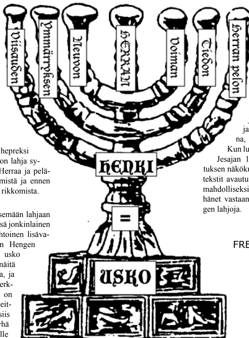
Herran temppelin Seitsemääräisen lampunjalan, Menorahin, avulla voidaan kuvata Pyhän Hengen työtä ja lahjoja.