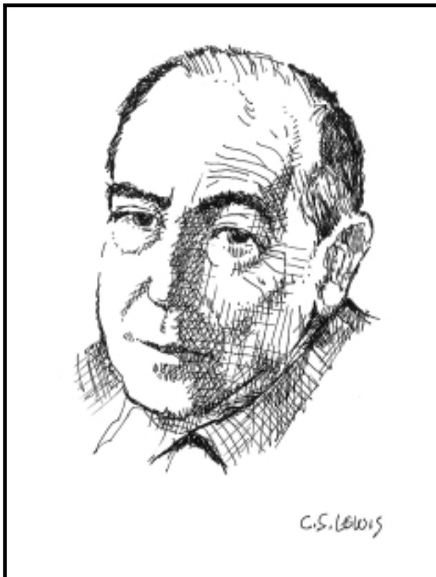
C.S. Lewis oli ateisti, josta tuli tunnettu kristillisen uskon puolustaja. Hän toimi kirjallisuuden professorina ja käytti usein kaunokirjallisuudesta nousevia esimerkkejä selvittäessään Jumalan sanan totuuksia.

On varmasti niin, että mikäli kaikki nämä oletukset joskus toteutettaisiin, me olisimme astuneet toiseen uskontoon. Jumalattaria on tietenkin palvottu ja monissa uskonnoissa on naispappeja. Mutta ne ovat uskontoja, joiden luonne on hyvin erilainen kuin kristinuskon. Terve järki tulee kysymään: "Miksi ei?" Se jättää huomioonottamatta levottomuuden tai jopa kauhun tunteen, jonka ajatus koko teologisen kielen muuttamisesta feministiseksi herättää useimmissa kristityissä. Jos kerran Jumala ei itseasiassa ole biologinen olento, eikä Hänellä ole sukupuolta, mitä merkitystä sillä on, kutsummeko Häntä mieheksi tai naiseksi, Isäksi tai Äidiksi, Pojaksi tai Tyttäreksi?