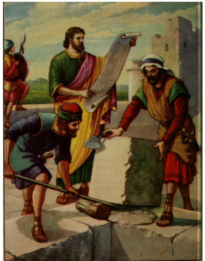
Nehemia korjaa Jerusalemin muurit.