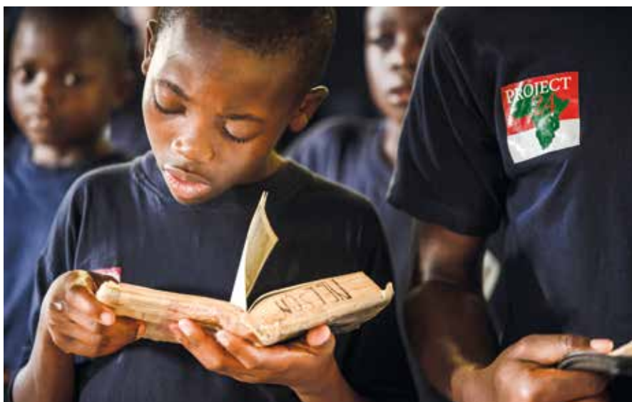
Kenialaisia poikia osallistumassa luterilaiseen jumalanpalvelukseen helmikuussa 2022. The Lutheran Church Missouri Synodin ja Kenian evankelis-luterilaisen kirkon yhteistyöprojekti Othoro pitää huolta apua tarvitsevista lapsista.

Suomessa seurakunta ja muu yhteiskunnallinen elämä ovat yleensä erillisiä asioita. Yhteiskunta huolehtii ruumiillisista ja aineellisista, kirkko sielun tarpeis-