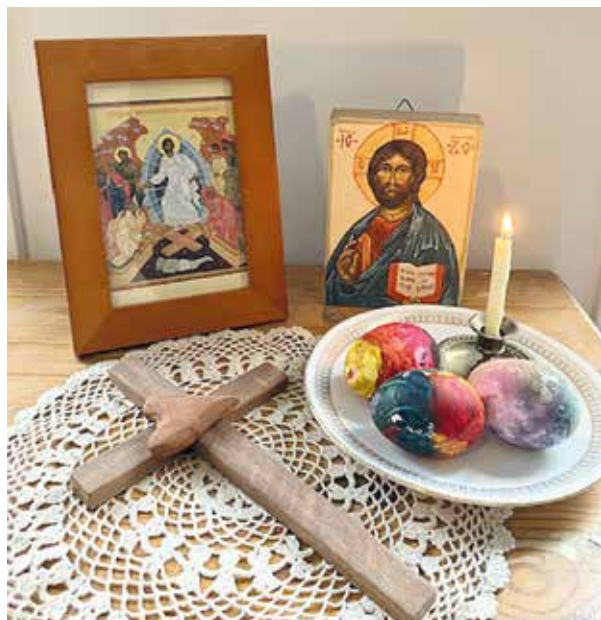
Abot juhlivat pääsiäistä perheen ja seurakunnan kesken.

Pääsiäisen lähestyessä perhe valmistautuu juhlaan. Lapset tuovat päiväkodista ja koulusta kotiin pääsiäisruohot, maalataan munia ja syödäänkin pääsiäismunia. Elisa kertoo, että paaston aikana syödään vähemmän liharuokia