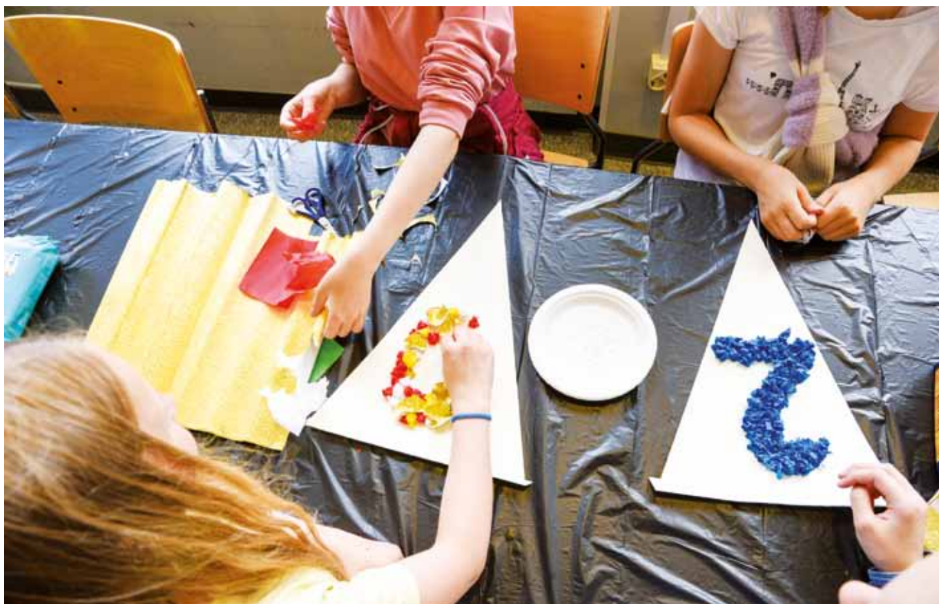
Lasten kanavassa puuhaillaan yhdessä.

– Sen lisäksi, että lapset ovat tervetulleita osallistumaan yhteiseen juhlaohjelmaan, haluamme tarjota heille ikätasoista raamattuopetusta ja toimintaa. Tulkaa ja katsokaa Jumalan töitä -teema vie tänä vuonna lapset ihastelemaan Jeesuksen suuria tekoja. Kun Jeesus antoi sokealle näön, sokean silmät avautuivat näkemään Juma-