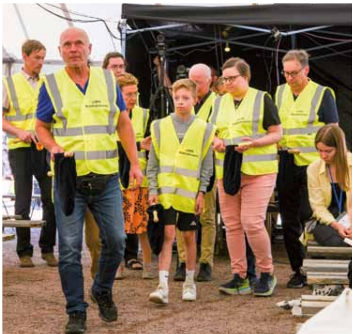
Talkoolaisia tarvitaan myös kolehdin keräämiseen.

– Olen osallistunut Kesäjuhlaan alusta asti. Kolmena viime vuotena olen pystyttänyt ja purkannut juhlatelttoja iloisten ja motivoituneiden talkoolaisien kanssa. Talkoot ovat olleet mieleenpainuvia: yhtenä kesänä hikoilimme telttojen kimpussa 30 asteen helteessä ja seuraavana kesänä rankkasatees-