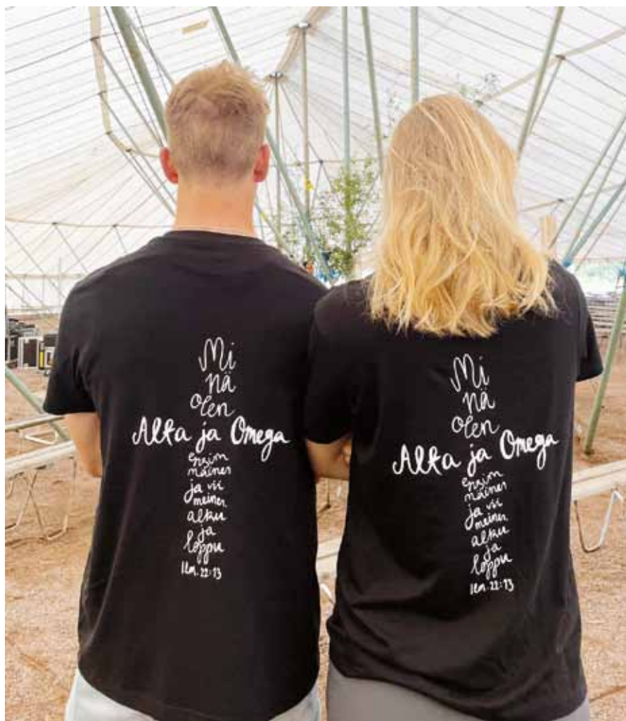
Nuorten aikuisten "Alfa ja Omega" -oheistuotteet ovat myynnissä myös tänä kesänä.