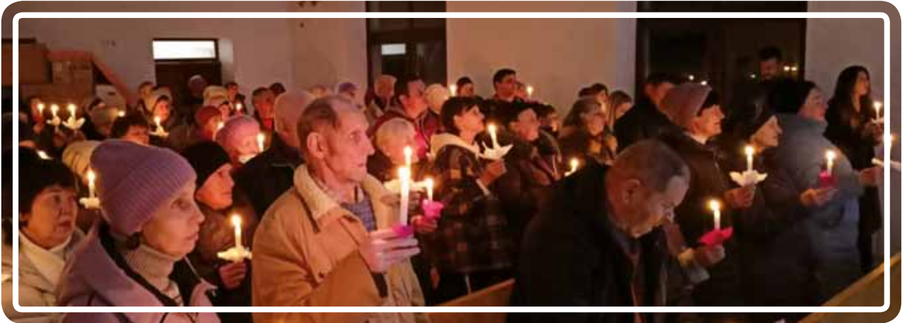
Jouluyön messu Odessassa.