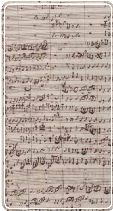
Bachin säveltämän jouluoratorion ensimmäinen sivu

Bachin vielä klassisesta luterilaisuudesta ponnistava, mutta jo uuden ajan äärellä oleva kristillisuus oli yhtä aikaa sekä verevää että syvällistä. Se ei ilmaissut aneemisia ideoita, ei tyhjän päällä leijuvia tunteita, ei ahdistunutta piipittämistä eikä tylsää tyhjänpuhumista, vaan oli syvästi vakavaa ja taivaallisen tanssillista.