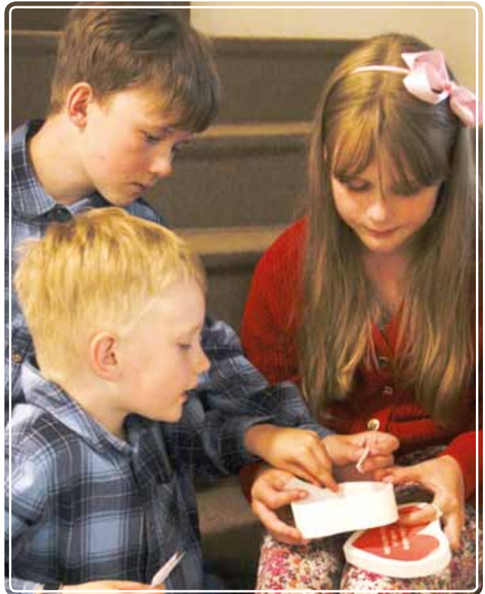
Sydänrasian sisältä löytyy Raamatun jakeita.